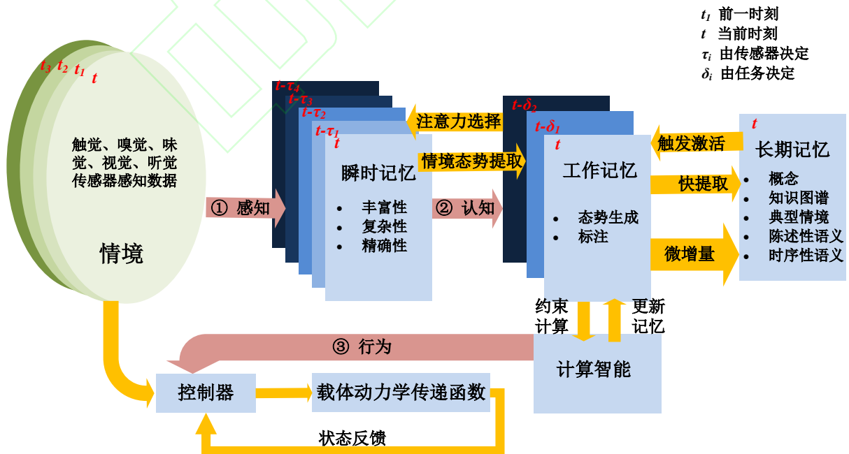
图2 新一代人工智能时空架构

其实这和冯架构为基础的计算机智能并不排斥，计算智能可看作是新一代人工智能中的一个重要组成，无论是数值计算、符号计算，还是图计算，都是在公理、常识、原则、规律、规约、模型、方法等前提下的推理或思考，这些前提就是认知的模型，多种模型可以分别是已有的记忆对当前计算的多元约束和监督。